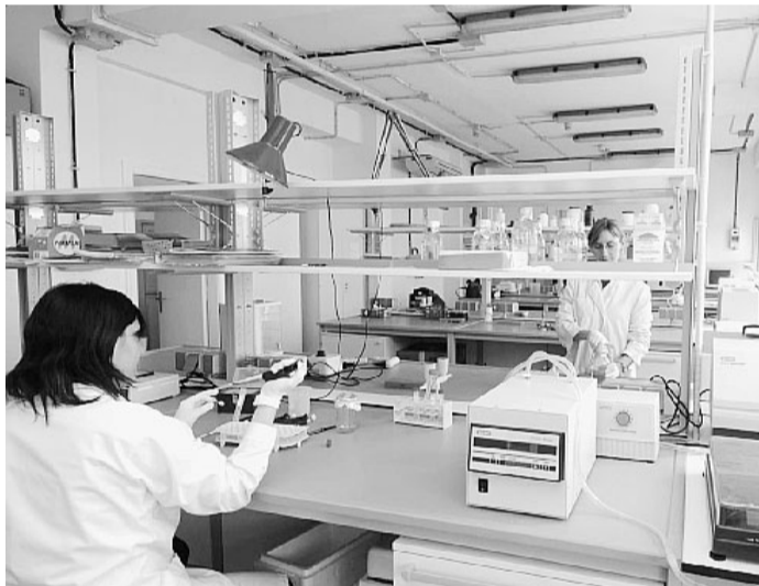
Un gruppo di ricercatori al lavoro

Modena si prepara così a fronteggiare i malanni della stagione fredda e il possibile arrivo del-