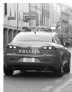
Volante della Stradale

H anno visto una macchina sfrecciare e l'hanno fermata, convinti di fare una multa ad un automobilista spericolato, e invece, la pattuglia della polizia stradale ha trovato una sorpresa: una donna che stava per partorire accompagnata da un agitatissimo marito. A quel punto gli agenti non hanno potuto fare altro che accendere i lampeggianti e scortare, letteralmente, i due coniugi al Policlinico di Modena per ricoverare la donna. Un episodio da film che ha visto protagonista una 34enne modenese che ieri pomeriggio si è resa conto che iniziava il travaglio e, accompagnata dal marito, è salita in macchina per correre verso il Policlinico. La coppia, verso le 15, si stava dirigendo verso l'ospedale a tutta velocità, quando, all'altezza di Vacciglio, ha incontrato una pattuglia della Stradale che gli ha intimato l'alt. Gli agenti hanno fermato l'auto in corsa per chiedere spiegazioni, ma quando si sono resi conto della situazione critica hanno deciso di accompagnare i coniugi per essere certi che la futura mamma facesse in tempo ad arrivare in ospedale prima di dare alla luce il bambino. Lampeggianti spigati, le due auto hanno raggiunto il Policlinico, dove poco dopo è nato il piccolo Alessandro.