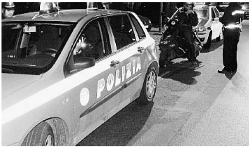
Sul posto è intervenuta la polizia