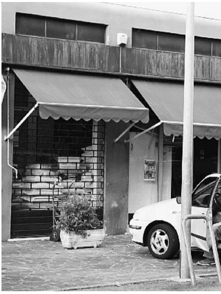
Il negozio etnico criticato dai residenti