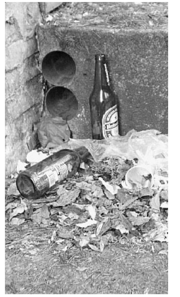
Bottiglie di vetro lasciate a terra

«In tanti - spiega - stanno segnalando la situazione di degrado e di disturbo della quiete pubblica causata in via Carbonieri dalla presenza di decine di stranieri che fanno baccano fino a tarda notte. Consumano bevande alcoliche, fanno i loro bisogni nei cortili privati, importunano e minacciano i residenti. Per questo chiedo alla giunta come intenda agire nei confronti della proliferazione incontrollata dei negozi etnici. Anche in via Carbonieri, infatti, certi assembramenti si verificano davanti a un esercizio di questo genere. È inaccettabile».