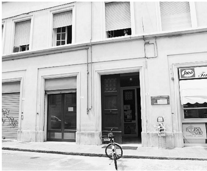
Il Sert in via Sgarzeria

In teoria doveva essere un modo per avvicinarsi e chiarire cosa non va dalle parti di via Sgarzeria: in realtà, l'incontro sul Sert tra residenti e amministrazione - si è tenuto martedì scorso al dopolavoro di via dell'Abate - non ha fatto altro che rimarcare le distanze. A tornare sulla questione è un gruppo di residenti di via Sgarzeria, che fa notare che «all'assessore Maletti che i quattro gatti nel 2001 hanno raccolto quasi 2.500 firme in poche settimane: ora ci chiediamo se queste firme siano finite al macero e perché non abbiano mai avuto un peso. Durante l'incontro, il responsabile del Sert ha snocciolato i numeri con onestà, e così ora sappiamo che in via Sgarzeria vengono assistiti 450 pazienti residenti e 200 che vengono da fuori - troppi e in crescita - nonostante il decentramento di altri servizi e la recente riapertura del servizio a Castelfranco per 150 utenti di