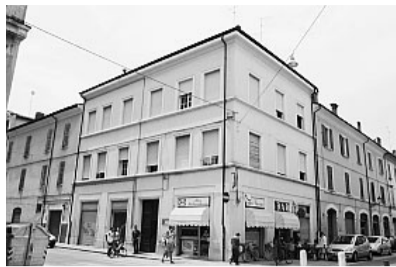
La sede attuale del Sert in via Sgarzeria

«Il Sert? Spostatelo dappertutto, ma non dentro il Policlinico»